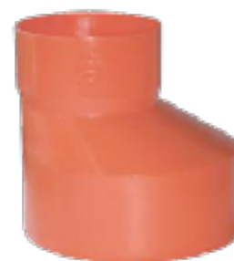
\varnothing 50 x \varnothing 100 x h 125 mm